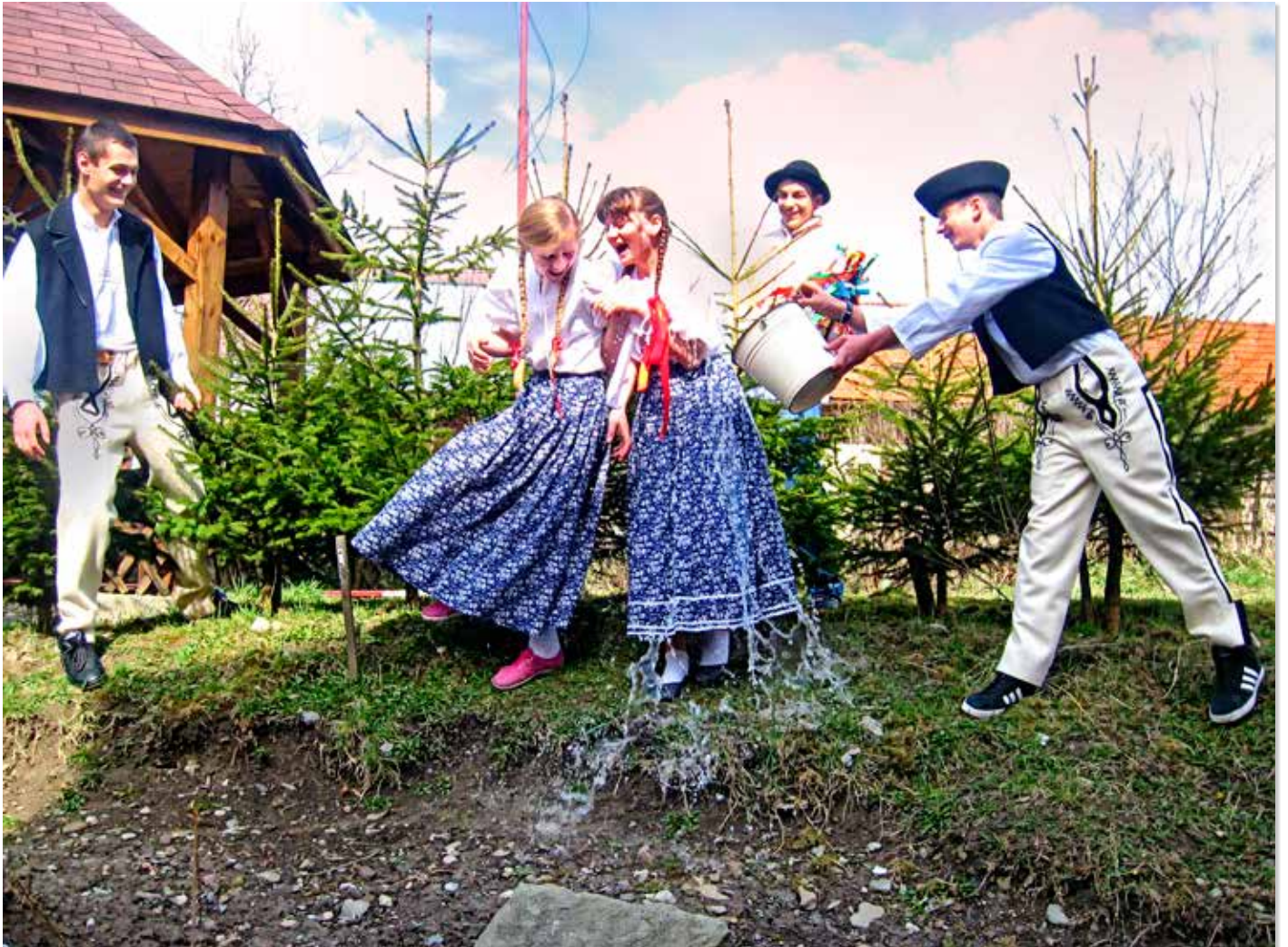
Veľkonočná tradičná obliečka životodarnou zdravou vodou – jarná očista