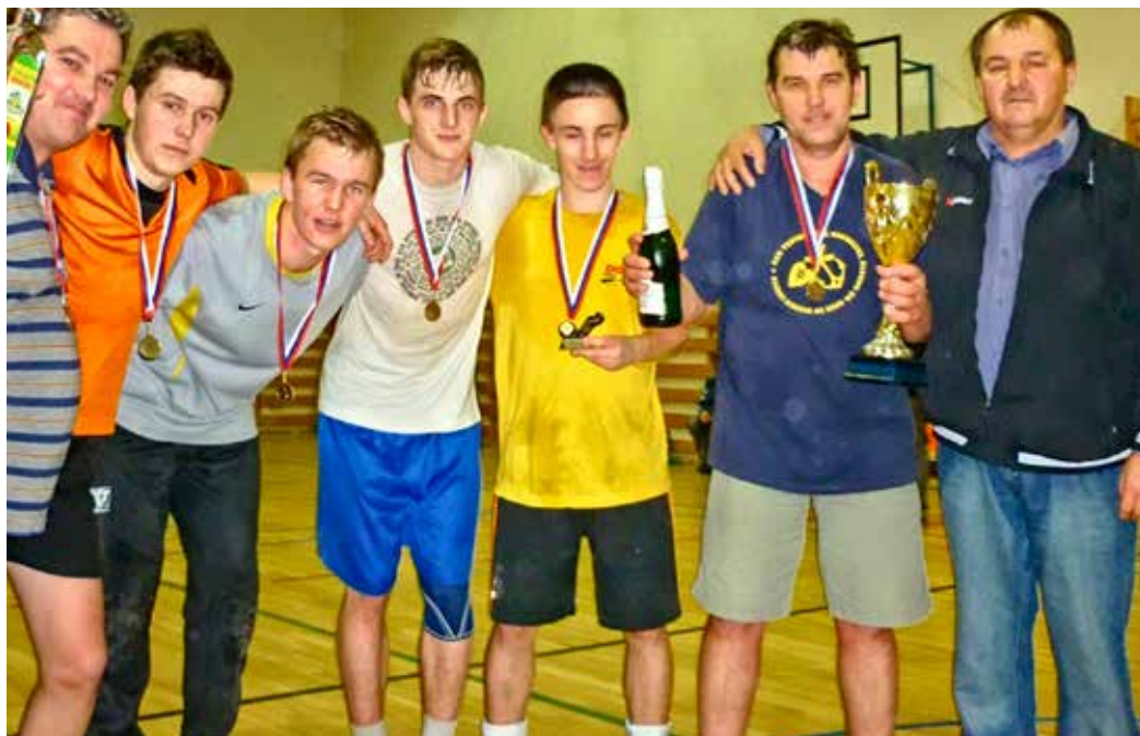
1. Chudjak team (vítaz turnaja)