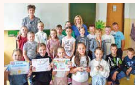
Na 1. stupni bola najviac ocenená 3.A

pridávali aj jednoduché tance. Svoje schopnosti sme potom prezentovali v piatky na hodinách Triedneho spoločenstva. Vyhodnotenie našich umeleckých zručností sme sa dozvedeli v prvý májový piatok. Po svätej omši v škole sme sa dozvedeli, že najlepšou triedou z 2. stupňa v ľudovej aj gospeľovej piesni sme sa stali my, 6.A. Naozaj sme sa veľmi tešili. 1. miesto v anglickej piesni na 2. stupni vyhrali žiaci 5.B. Z 1. stupňa boli najlepší speváci z 3.A, ktorí vyhrali anglickú aj gospeľovú pieseň. 1. miesto z ľudovej piesne si vybojovali prváci pani učiteľky Poltárovej. Keďže sme mali až dve prvé miesta, za odmenu išla