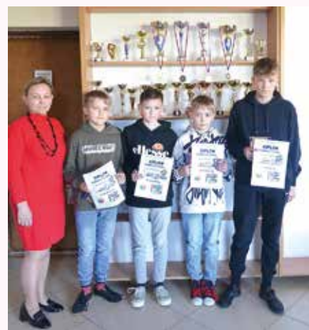
Vítazi školského kola, ktorí postúpili do Oravského Veselého

4.A, ktorému gratulujeme k 3. miestu v 1. kategórii.