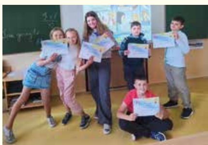
Naši žiaci prvýkrát úspešne zapojili do medzinárodnej súťaže ENGLISH STAR, kde si otestovali svoje vedomosti z anglického jazyka.