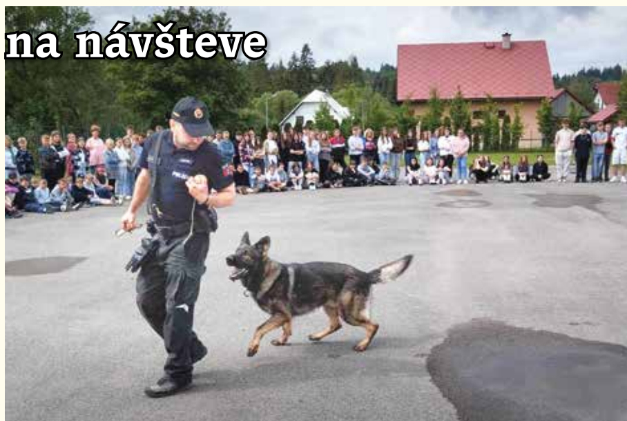
...psík hľadá omamné látky...

Druhý vyhľadával podozrivé osoby a páchatelov. Útočil na páchatela,