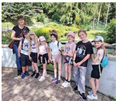
Deti si urobili aj výlet do Bojníckej ZOO