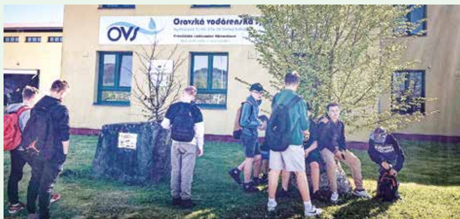
...na čističke odpadových vôd...