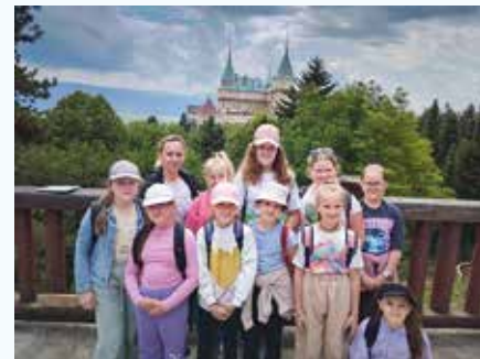
Mladší žiaci si zas užili Bojnice