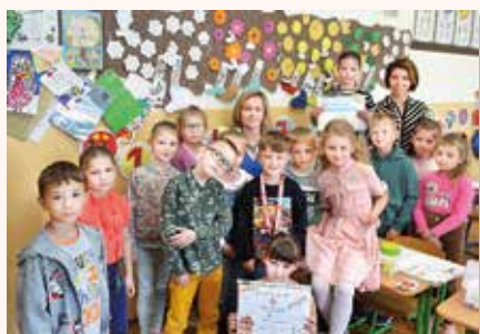
Aj mali prváci získali diplom

Školou sa niesol spev a hudba. Bolo naozaj veselo. Každá trieda chcela zaujať a vyhrať aspoň v jednej kategórii. Kategórie boli tri. Prvú sme mali zaspievať ľudovú pieseň, potom gospeľovú a na koniec anglickú pieseň. Niektoré triedy nacvičovali na hudobnej výchove iné na triednických hodinách či cez prestávky. Trénovali s napätím, netrpezlivosťou ale mnohí i so strachom v očiach, že budú musieť spievať na pódiu pred obecnosťou. No mnohí sa nebáli ukázať svoj talent v hre na hudobný nástroj a spev triedy ním doprevádzali. Ku spevu a hre žiaci neskôr