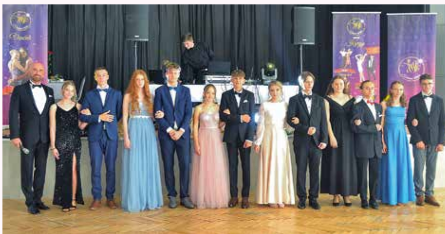
Absolútni víťazi Venčekového plesu