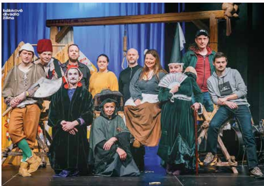
v Bábkovom divadle v Žiline