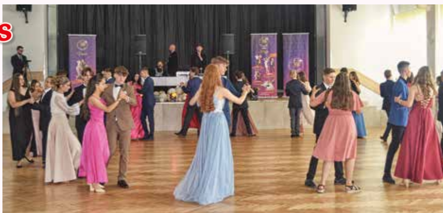
Deviataci na plese predviedli svoje tanečné umenie. Z ich tanca mali prítomní umelecký zážitok.