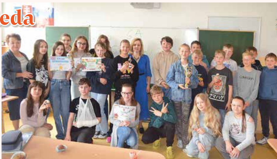
Výhercovia v každej kategórii zo 6.A

pridávali aj jednoduché tance. Svoje schopnosti sme potom prezentovali v piatky na hodinách Triedneho spoločenstva. Vyhodnotenie našich umeleckých zručností sme sa dozvedeli v prvý májový piatok. Po svätej omši v škole sme sa dozvedeli, že najlepšou triedou z 2. stupňa v ľudovej aj gospeľovej piesni sme sa stali my, 6.A. Naozaj sme sa veľmi tešili. 1. miesto v anglickej piesni na 2. stupni vyhrali žiaci 5.B. Z 1. stupňa boli najlepší speváci z 3.A, ktorí vyhrali anglickú aj gospeľovú pieseň. 1. miesto z ľudovej piesne si vybojovali prváci pani učiteľky Poltárovej. Keďže sme mali až dve prvé miesta, za odmenu išla