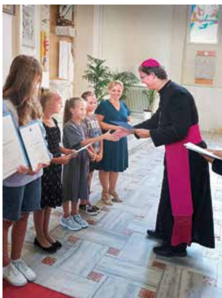
Slávnostné odovzdávanie pochvalných podakovaní v Konkatedrále v Poprade