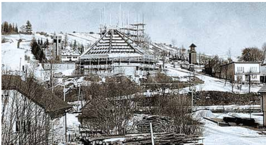
Monografia Rímsko-katolícka farnosť Rabča s. 118, 2006