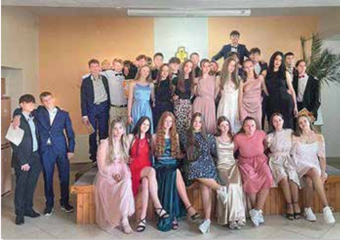
...naši bývalí deviataci...