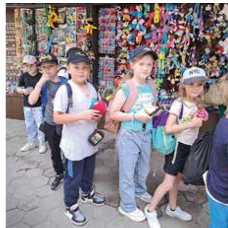
Nechýbali ani malé nákupy. Každý chcel domov priniesť niečo na pamiatku pre seba i svojich blízkych.