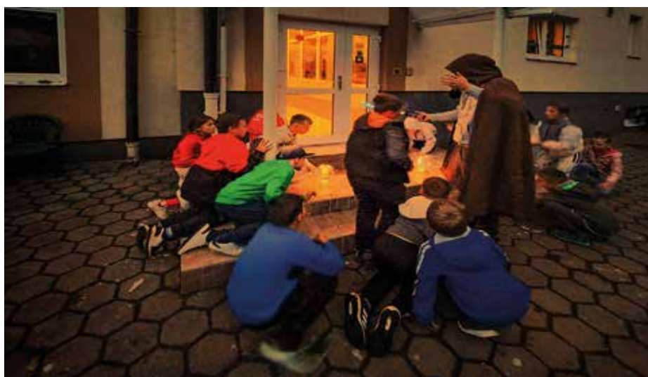
Večerné aktivity deti veľmi zabavili