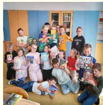
Štvrtáci so svojimi novými knihami

nakreslili do komiksu. Každý sa s radosťou pustil do práce, pretože komiksy máme veľmi radi. Nakreslené komiksy sme nalepili na jeden veľký papier a vytvorili sme tak komiksovú veľdielo 4.B – Naše prázdniny. Ku obrovskému plagátu sme ešte priložili