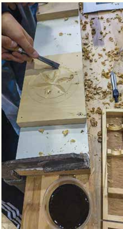
...drevorezba dala žiakom zabráť, nevyhli sa ani drobným úrazom...