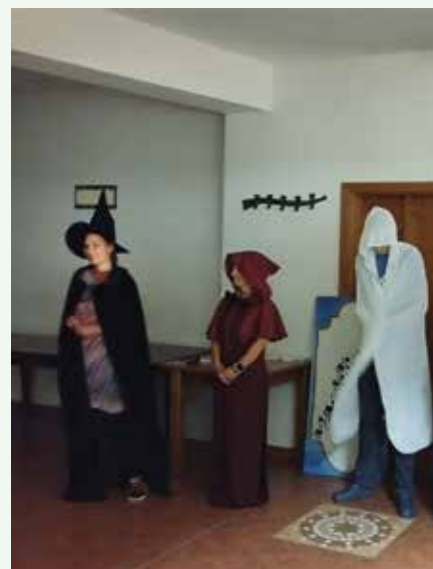
Deťom sa venovali aj animátori

Domov si odnášali nielen skvelé zážitky, ale do batôžka si pribalili aj