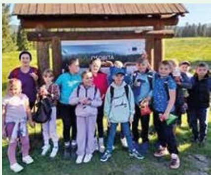
...v Juráňovej doline...

Juráňova dolina je krásna tiesňava v Západných Tatrách, ktorá sa nachádza asi 850 metrov nad morom.