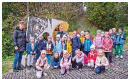
Na krížovej ceste v Trstenej

Pútnické miesto Skalka vzniklo už v roku 1870, vtedajší richtár dal do skaly vytesať kaplnku, pri ktorej sa veriaci schádzali pri modlitbe a pobožnostiach. V roku 2000 bola