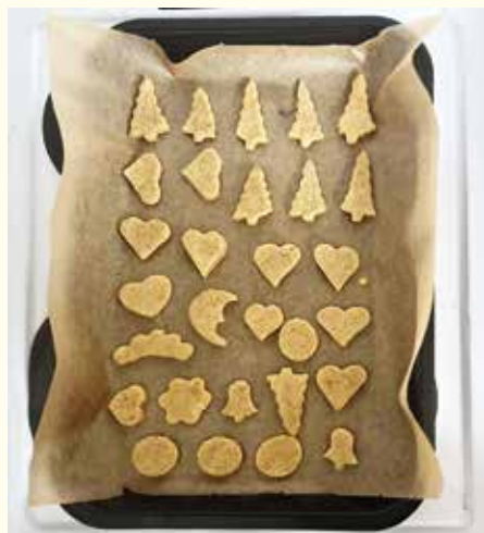
...voňavé medovníky sú pripravené na pečenie...