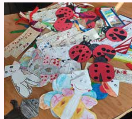
Naše záložky poputovali do Čiech