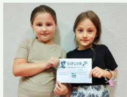
Deti dostali za svoje vzorné správanie a plnenie aktivít pekné diplomy

kus zodpovednosti a samostatnosti, ktorej sa naučili. -red-