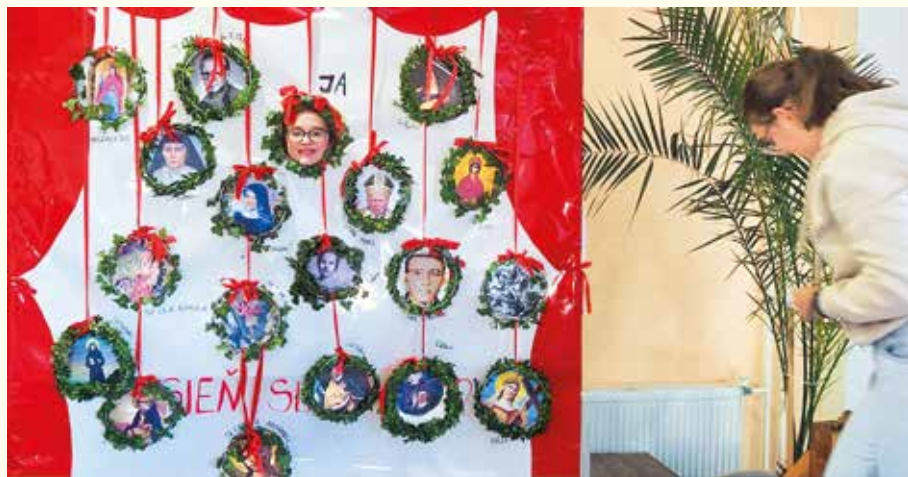
...fotostena so svätcami...