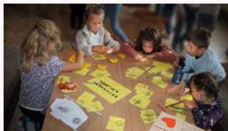
Deti si pripravujú smajlíkov, aby ich mohli niekomu darovať

4. októbra sme oslávili tento deň tak, že sme posielali smajlíkov tým, ktorým sme chceli urobiť radosť, prípadne im za niečo poďakovať. Deti si na hlavnej chodbe mohli vybrať a vymalovať smajlíka, ktorého potom doručili svojim kamarátom, pani učiteľkám, školníkovi i pani upratovačkám. Malý smajlík