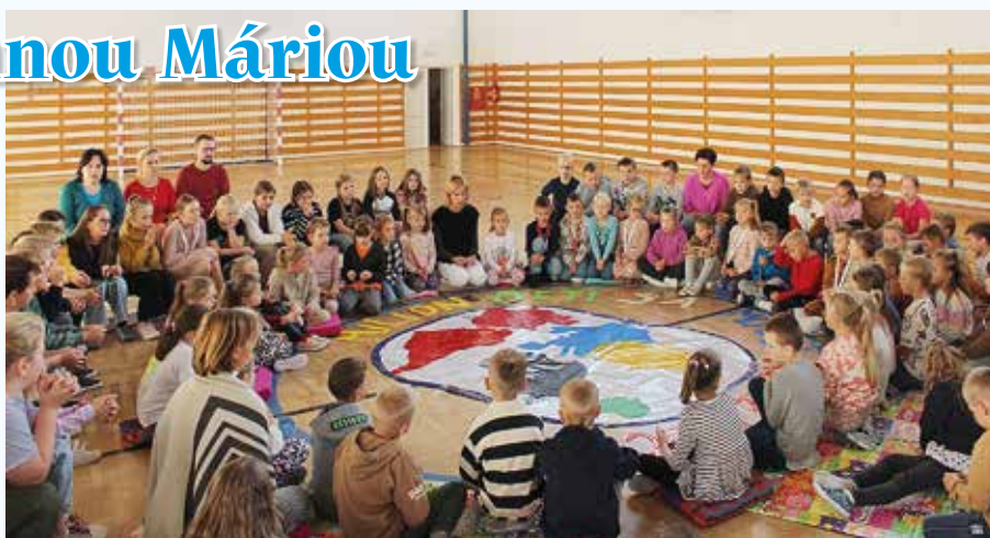
Pri modlitbe ruženca – Milión detí sa modlí ruženec

Na hlavnej chodbe nás pri vstupe do školy víta socha Panny Márie. Tú počas mesiaca ozdobili malí prváčikovia, ktorí jej vyrobili krásny ruženec, a tak ju ozdobili. Každý deň počas veľkej prestávky sme sa v kaplnke modlili desiatok ruženca. Svoje úmysly sme vždy vhadzovali do vopred pripravenej krabičky. Modlili sme sa za zdravie naše i našich blízkych, aby sme boli šťastní, aby sme dostali dobré známky. V piatok 18. 10. sme sa zapojili do projektu Milión detí sa modlí ruženec. O deviatej ráno sa deti z 1. stupňa vo veľkom kruhu