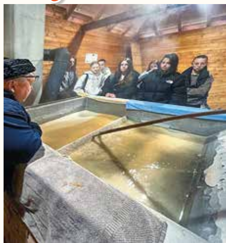
V Oravskej Polhore pri odparovaní soli