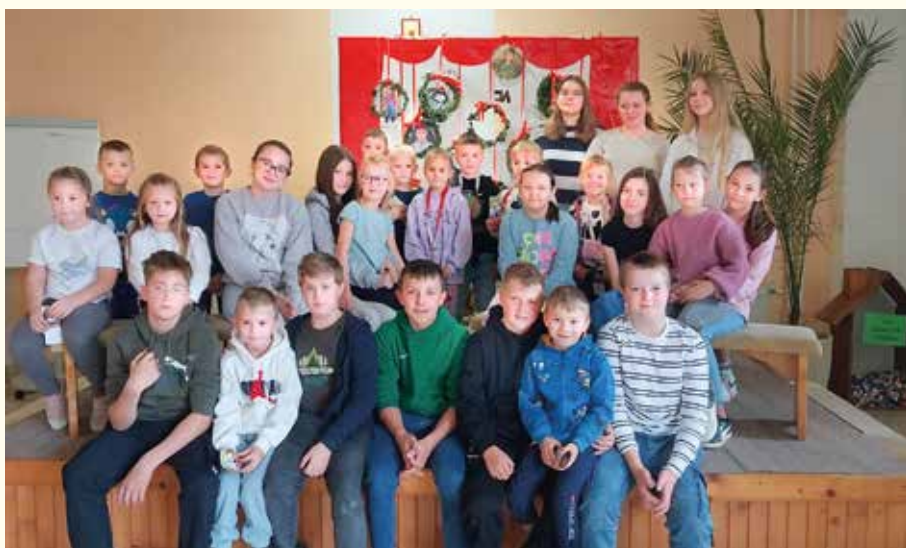
...siedmaci spolu s prvákmi...