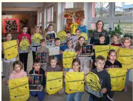
Stravovať zdravo sa oplátilo. Deti si domov odniesli pekné ceny.

V piatok 8. 11. 2024 rozdali zástupcovia školského parlamentu všetkým žiakom milé kľúčanky a plagátky s nálepkami ovocia.