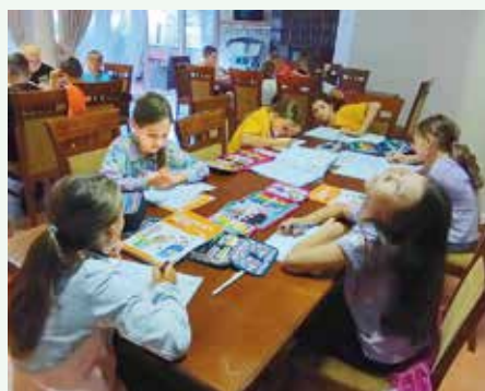
Učenie v škole v prírode

Deti začínali svoje ráno rozcvičkou, potom sa učili a poobede ich čakali rôzne aktivity s animátormi. Vychutnali si aj turistiku, nechýbala nočná hra či večerná párty.