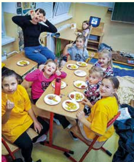
...šantenie pri super hrách...

Celá sa niesla v duchu rozprávky V hlave 2. Deti začínali o štvrtej popoludní v piatok 18. októbra a končili o deviatej v sobotu. Začali tým, že každé dieťa si vylosovalo stužku, aby vedelo, ku ktorej skupinke patrí. Hneď potom sa presunuli do tried a vymýšľali si pokrik, navrhovali vlajku podľa emócie, ktorú mali, robili divadielko podľa scény z filmu a hrali sa rôzne hry. Keď boli hotoví, presunuli sa na hlavnú chodbu a prezentovali scénu, vlajku a svoj pokrik. Hrali sa hru Hľadaj animátora. Deti dostali tabuľky a animátori kartičky s emóciou, napríklad hnev, smútok, závišť... Potom sa presunuli do tried a mohli si zapnúť film V hlave 2. Popri pozieraní si dali chutné hranolky. A prišla