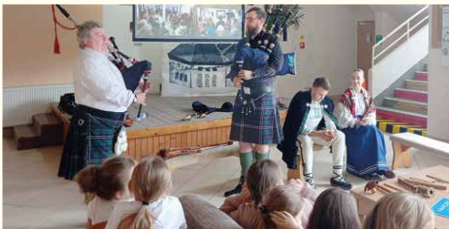
Gajdoši zo Škótska