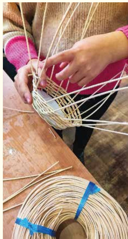
...pletenie košíčkov z pedingu...

O týždeň 21. novembra sa naše i poľské deti pod vedením lektora z Martina pustili do pletenia košíkov. Naši predkovia z prútia dokázali vyrábať krásne úžitkové koše, ktoré boli súčasťou ich