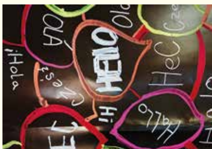
Medzinárodný deň jazykov – 26. september

Cyryl a Metod si našiel miesto v našom kalendári 9.12. Poslúchli panovníka Michal III. a išli na Veľkú Moravu. Žiaci sa mali pokúsiť ne byť leniví a poslúchnuť na prvé slovo.