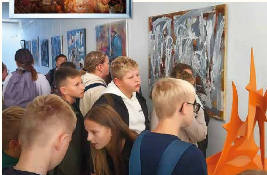
...v Galérii Márie Medveckej v Tvrdošíne...